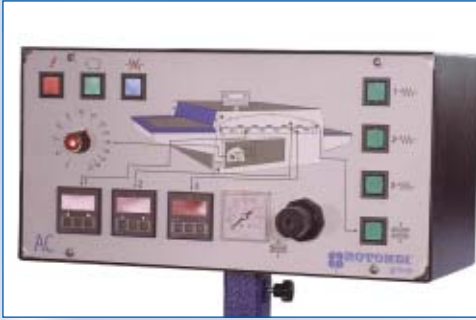
■ Pannello di controllo Serie AC ■ AC Series Control panel