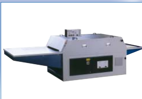
■ AC-110 senza scarico automatico ■ AC-110 without automatic take-off device