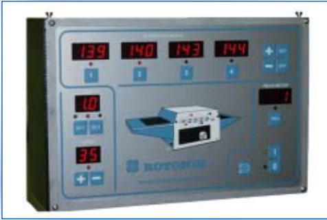
■ Pannello di controllo elettronico serie AC-G con 4 zone di riscaldamento ■ AC-G series electronic control panel with 4 heating zones