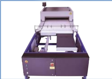
■ Scarico automatico a due piste ■ Double lane automatic take-off device